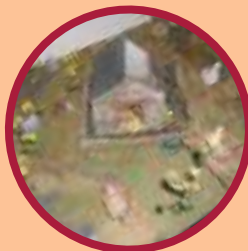
Poulailler miniature Travail de la dextérité (Une dizaine de matériaux utilisés)

Éléments décoratifs pour une salle de restauration