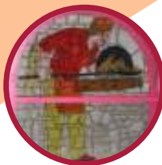
Mosaïque "La Sainte Claire" pour une résidence qui porte ce nom