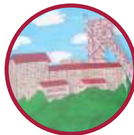
La Mine de Bois 2 Tableau en 4D réalisé par d'anciens mineurs retraités